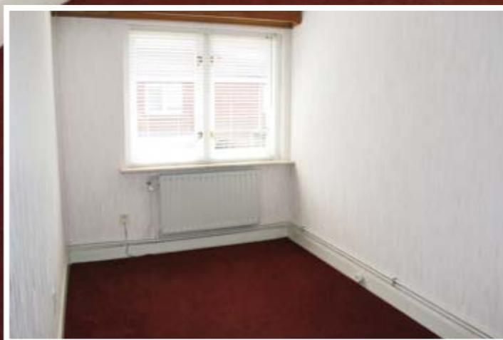
Eerste verdieping Overloop met vaste wastafel met warm en koud stromend water, inbouwkast, 3 slaapkamers waarvan 2 met inbouwkasten en vlizo-trap naar bergzolder.